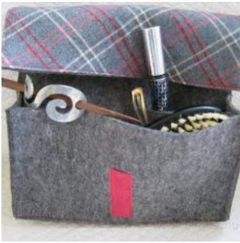
kult "karo-grau" für Dies & Das