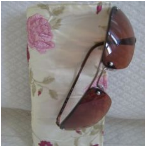
brille für Dies & Das