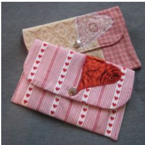
doku-bags 2 für Dies & Das