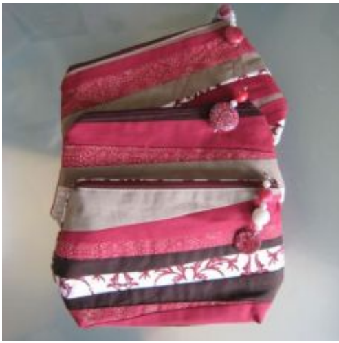
rv-22 "rot" für Dies & Das