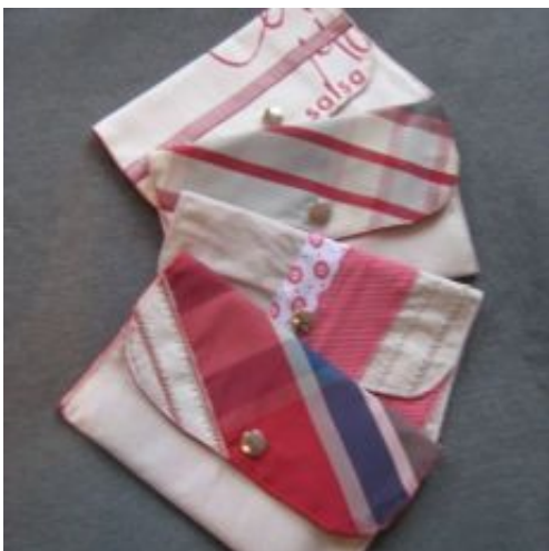
doku-bags für Dies & Das