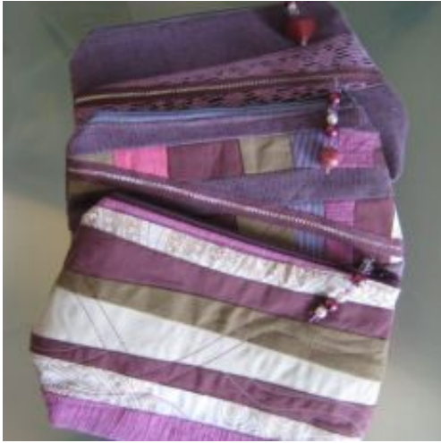
rv-22 "lila" für Dies & Das