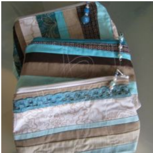
rv-22 "aqua" für Dies & Das