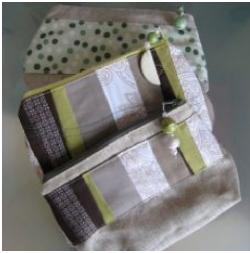
rv-22 "grün" für Dies & Das