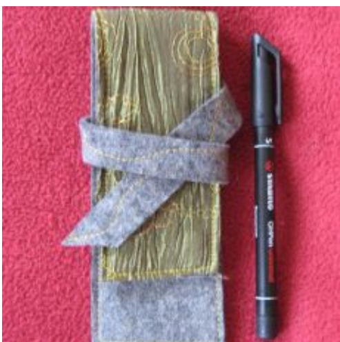
Stift-Etui für Dies & Das